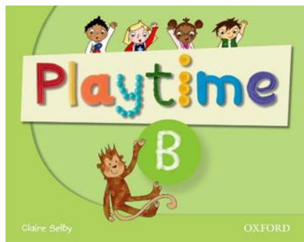
PLAYTIME B – CLASS BOOK Ed. SBS (Oxford)